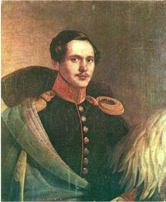
Портрет Михаила Лермонтова. Худ. Пётр Захаров-Чеченец.

В Италию для совершенствования мастерства художник так и не попал – рассказывают, что лично царь вычеркнул инородца из списка. А вольный итальянский воздух был бы куда как полезен Захарову – теплолюбивый сын Кавказа страдал в Петербурге "грудью". Вместо Италии он ездил в Парголово – на кумыс.