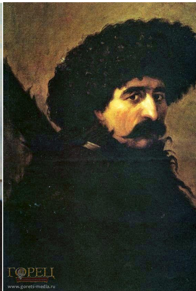
Пётр Захаров-Чеченец. Автопортреты Первый портрет написан в 1833—1834 гг., второй - в 1842 г.