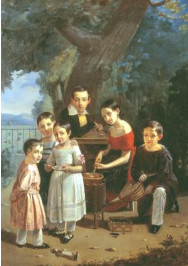
Дети Петра Ермолова. Худ. Пётр Захаров-Чеченец.

"...Я уже не свободный художник, а служащий в департаменте военных поселений Военного министерства. Потеряв здоровье и притом надежду быть отправленным за границу, я, покорный судьбе, решил избрать хоть немного, но верный кусок хлеба..."