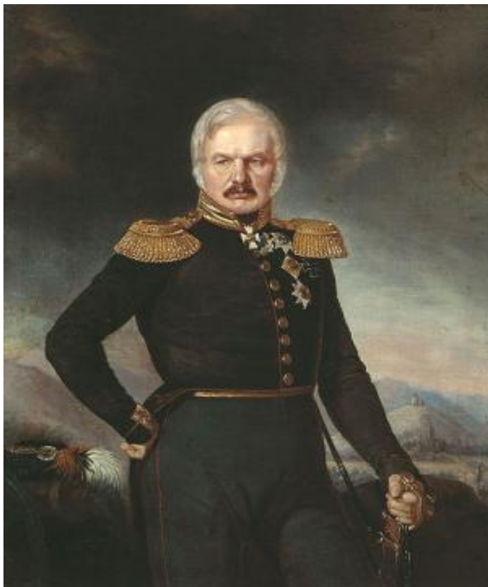
Портрет А.П.Ермолова. Худ. Пётр Захаров-Чеченец.